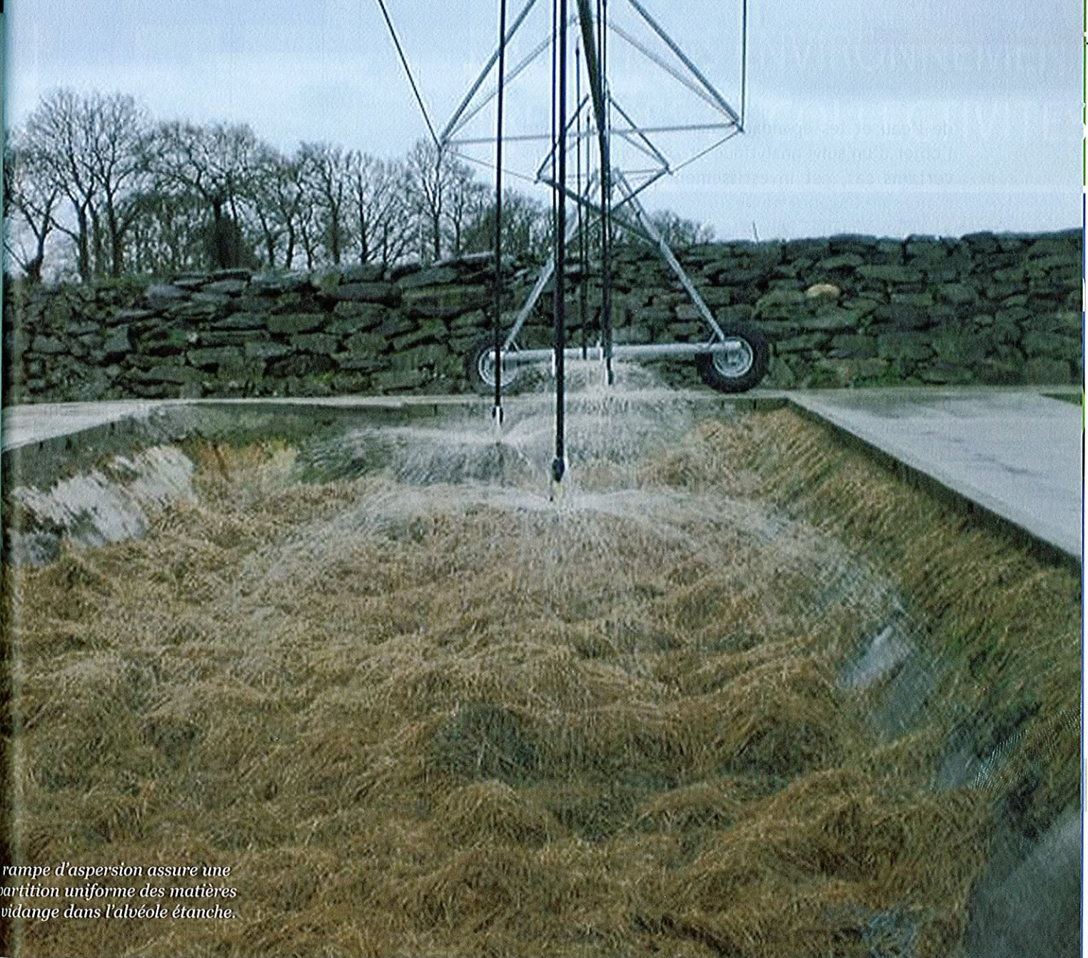
rampe d'aspersion assure une répartition uniforme des matières vidange dans l'alvéole étanche.